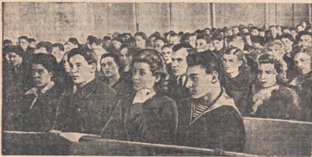
XIII городская комсомольская конференция. НА СНИМКЕ: в зале заседаний.