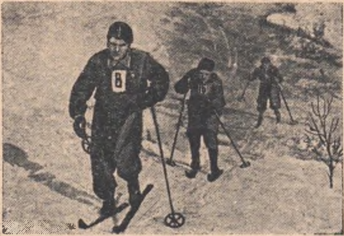
Трудный участок... лыжники преодолевают подъем.

Утро минувшего воскресенья выдалось на редкость ветреным и морозным. Встречи лыжников, участвовавших в розыгрыше приза газеты «Омская правда», проходили в сложных метеорологических условиях. Это, однако, не снизило интерес спортсменов-лыжников к первым городским соревнованиям: на старт прибыло 445 физкультурников — 132 команды.