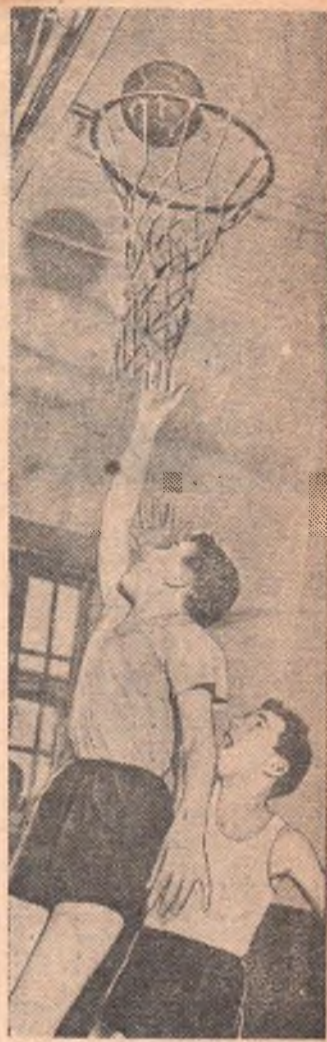
Острый момент...