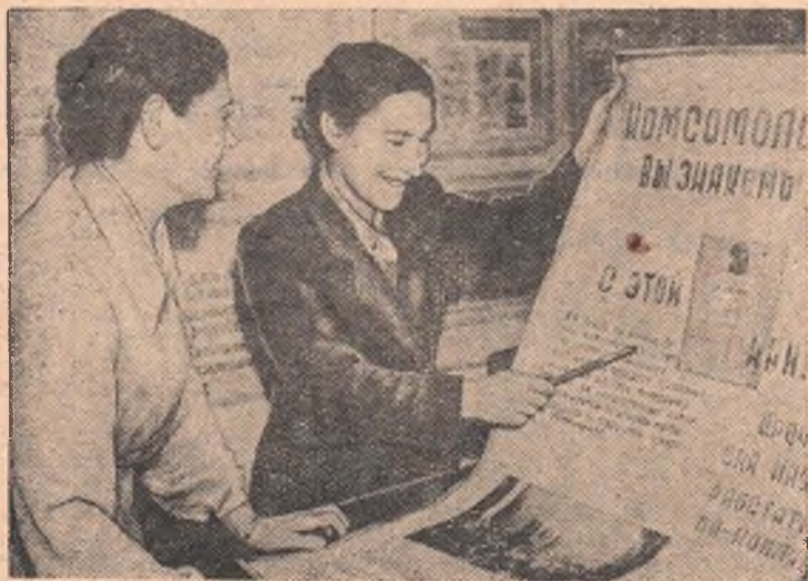
Многолюдно бывает вечерами в Одесской районной библиотеке. Здесь тепло, уютно, всегда найдется интересная книжка, статьи из газет и журналов.

В. МОНЧЕНКО, студент института физкультуры.