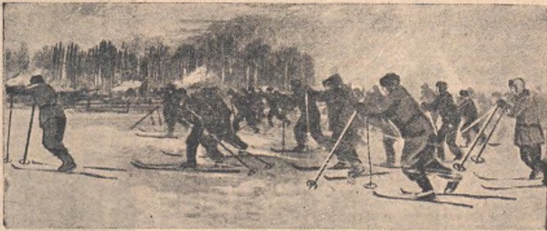
Участникам эстафетного бега 4 x 5 км. дан старт...

Саргатские коллективы физкультуры известны тем, что здесь наиболее массовым видом спорта является лыжный спорт. Колхозные физкультурники этого района первыми в области взялись за создание зимних спортивных баз. Сейчас в Саргатском районе в 21 из 24 колхозов есть свои лыжные базы, регулярно работают спортивные секции.