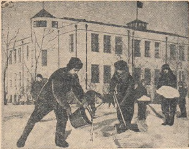
Ученики Омской средней школы № 4 расчищают площадку для катка.