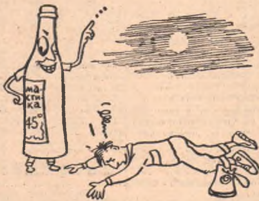
... семь, восемь, девять... аут!