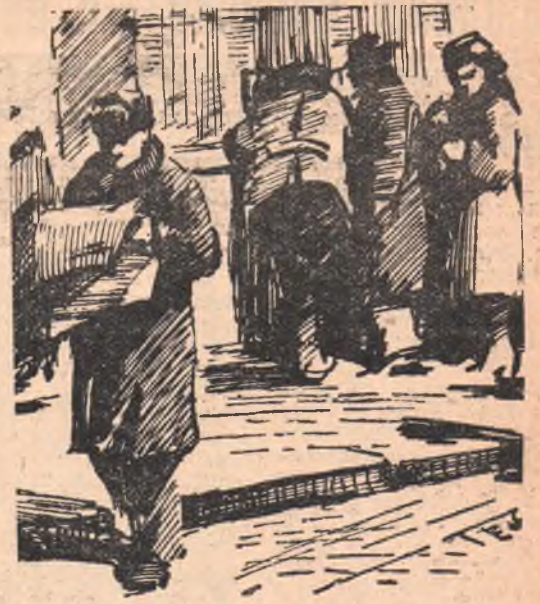
Свежий номер газеты. Рис. художника Г. Козлова.