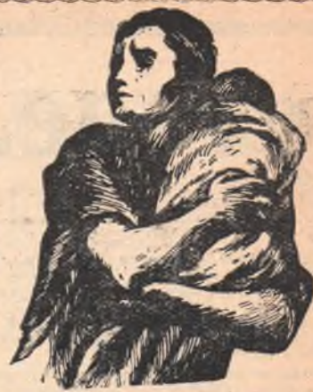
Мать против войны. По гравюре мексиканского художника Андреа Гомес.

Э ТО было несколько лет назад. В училище на имя комсомольской организации пришло письмо от детей одного из детских домов города Челябинска. Они писали: «Дорогие курсанты! Мы будем рады поддерживать с вами письменную связь. Нам очень хочется знать, как вы учитесь, живете, как изучаете наши замечательные советские танки. Пишите нам обо всем, а мы вам будем писать о своей жизни».