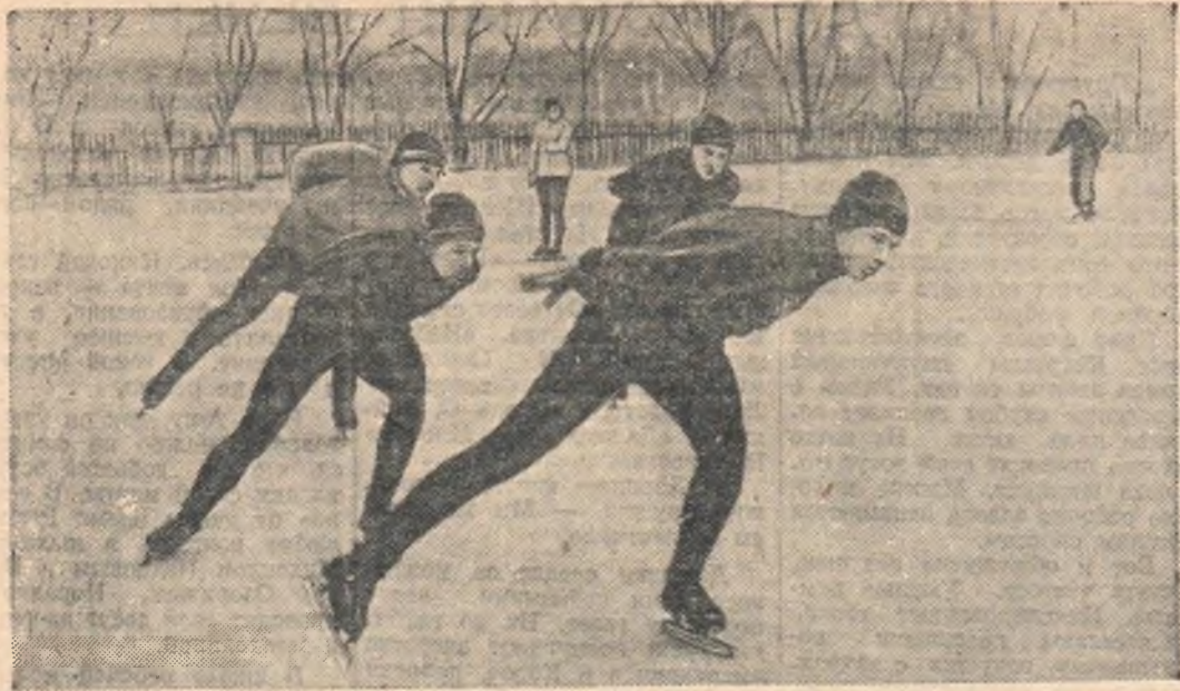
Многие студенты сельскохозяйственного института занимаются в конькобежной секции. НА СНИМКЕ: группа конькобежцев тренируется на институтском катке.

В то время, как в капиталистических странах, охваченных гонкой вооружений, продолжается свертывание гражданского производства, рост налогов и инфляции, усиливающих нищету трудящихся, в странах лагеря социализма и демократии наблюдается дальнейший расцвет экономики. Об этом свидетельствует, в частности, опубликованное 27 января постановление Совета министров Румынской народной республики и ЦК Румынской рабочей партии «О проведении денежной реформы и снижении цен».