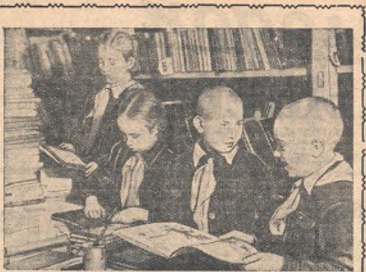
Книжный фонд детской библиотеки им. А. С. Пушкина, уже превышающий 23 тысячи экземпляров, продолжает систематически пополняться.