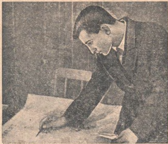
Большой популярностью в Омском машиностроительном техникуме пользуется газета «БОКС» («Боевой орган комсомольской сатиры»).

Неподготовленность конференции отразилась на ее качестве, причем многие студенты даже не присутствовали на ней. Кто в этом виноват? Тов.