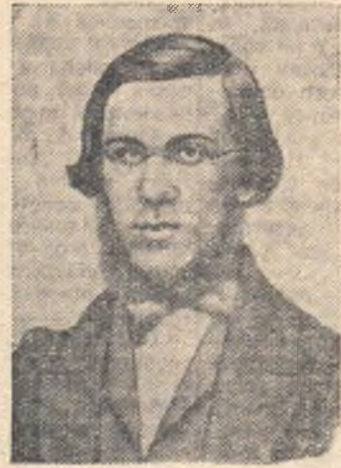
Н. А. Добролюбов. Литография 60-х годов.

В. ИОНОВА, ст. преподаватель кафедры педагогики пединститута.