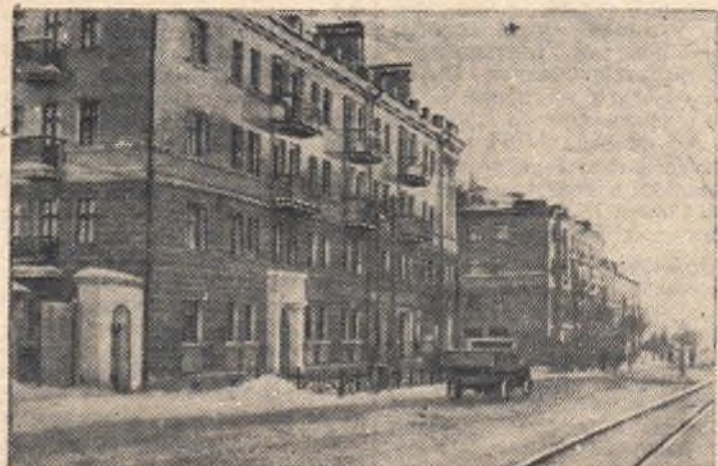
НА СНИМКЕ: многоквартирные дома, построенные по ул. Гусарова в 1950 году для рабочих и служащих предприятий Центрального района Омска.