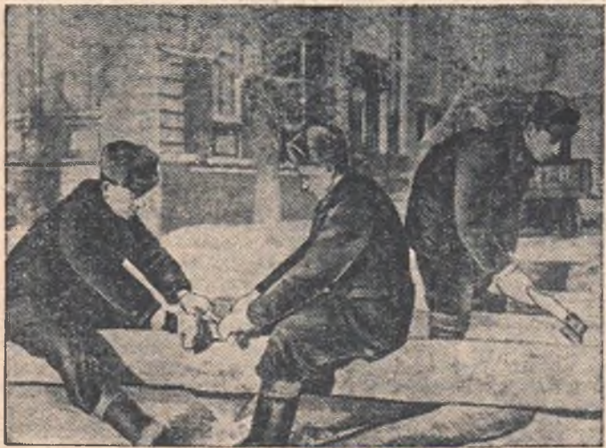
Школа ФЗО № 1 завоевала в областном соревновании переходящее Красное знамя Областного Управления трудовых резервов.