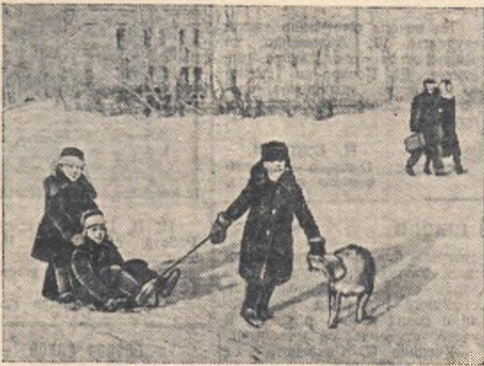
Скажите, кто б подумать мог, Что здесь недавно был каток?..

Примером такого «видоизменения» катков может служить ледяное поле, расположенное в самом центре Омска, напротив института физической культуры и девятнадцатой школы.