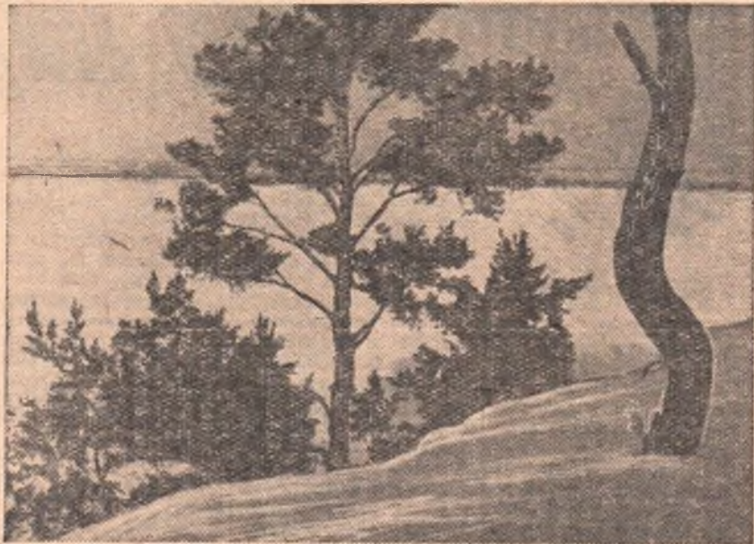
РОДНЫЕ ПЕЙЗАЖИ. Снимок сделан в Красноярском бору учащимся Омского химико-механического техникума В. Бурыаком.