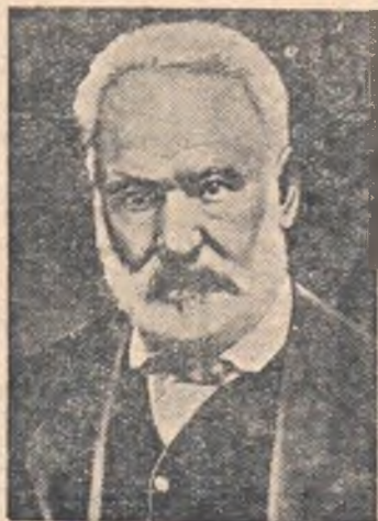
НА СНИМКЕ: В. Гюго.