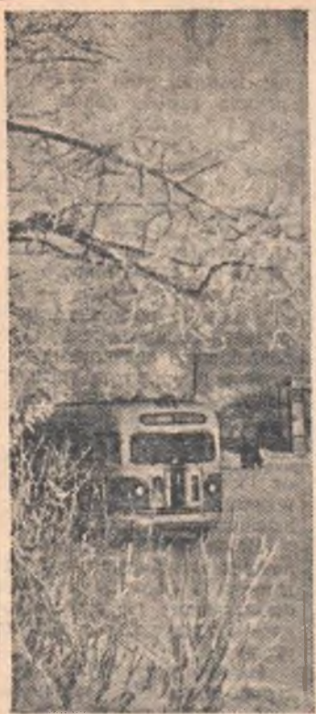
В зимний день.

ГОСЦИРК Неделя выступлений молодых артистов цирка, демонстрирующих свои новые достижения и рекорды. Большая цирковая программа при участии вновь прибывших артистов. Начало в 8-30 вечера.