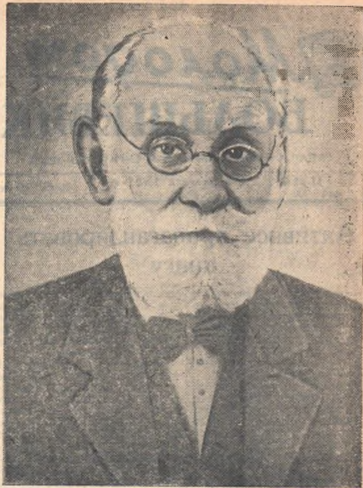
НА СНИМКЕ: И. П. Павлов.