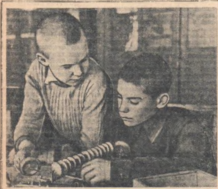
С увлечением посещают кружок юных механизаторов сельского хозяйства станции юннатов пионеры и школьники Тары.