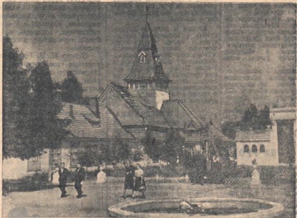
Полтавская область. Здание миргородского санатория, выстроенного на месте, где была лужа, описанная Н. В. Гоголем в «Повести о том, как поссорился Иван Иванович с Иваном Никифоровичем».

Но как ни мрачны картины российской действительности, нарисованные Гоголем в «Мертвых душах», его поэма все же не оставляет у читателя чувства безнадежности. Мы живо ощущаем в ней трепетную любовь писателя к своей Родине, твердую веру в ее скрытые до поры до времени силы. Дыхание огромной крестьянской страны служит в «Мертвых душах» как бы фоном, на котором разворачивается действие. В знаменитых лирических отступлениях поэмы Гоголь проникновенно говорит о своей любви к русскому народу, воспекает силу и красоту русского языка, утверждает мысль о великом предназначении своей Родины.