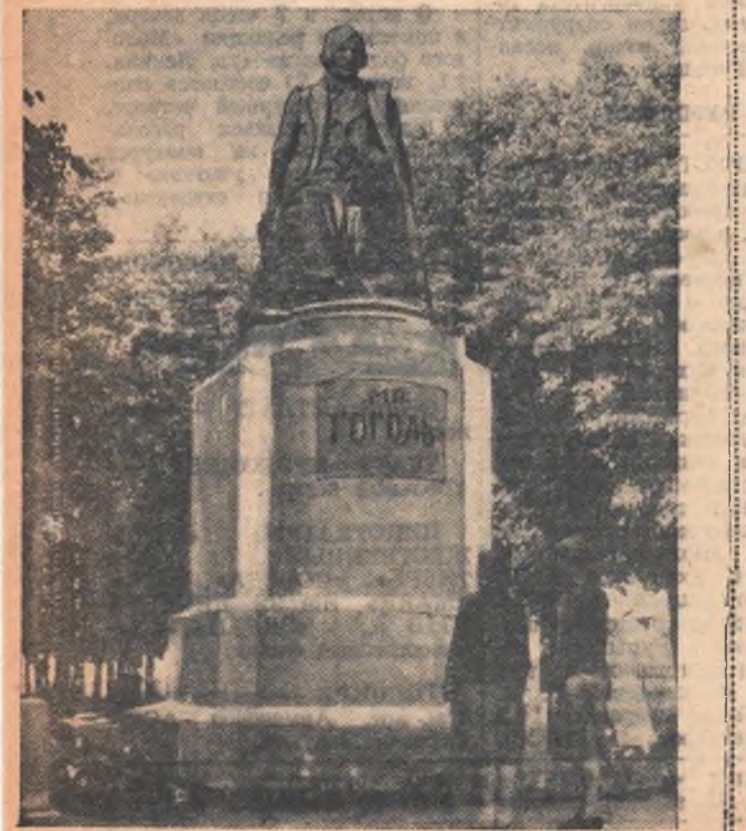
Украинская ССР. Памятник Н. В. Гоголю в г. Полтаве.