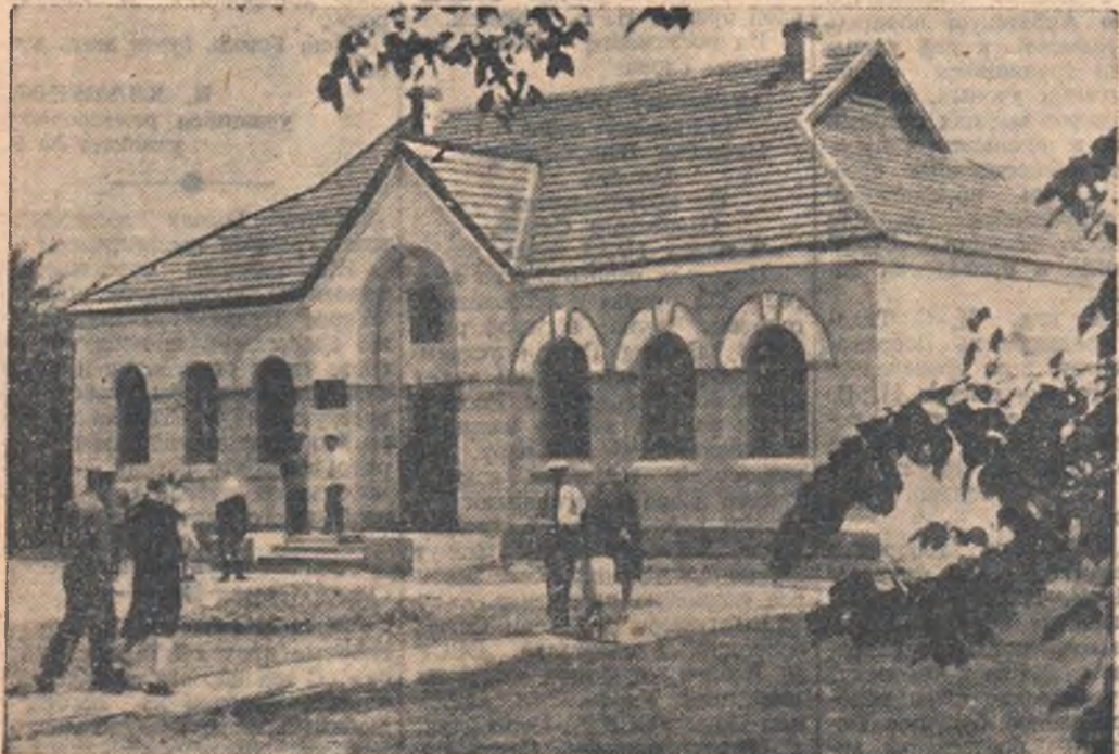
НА СНИМКЕ: музей Н. В. Гоголя в селе Сорочинцы Миргородского района Полтавской области. Здание музея построено на месте, где был дом, в котором родился Н. В. Гоголь.