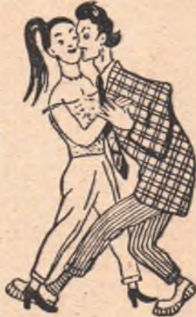
Как не надо танцевать.

Фокстрот и танго — красивые современные международные балльные танцы, но мы чаще их уродуем, чем танцуем правильно. Мне выпала честь в качестве судьи Международного конкурса в Москве видеть, в какой хорошей манере, с каким благородством и грацией исполнялись эти танцы представителями семи европейских стран и Советского Союза на паркете Колонного зала Дома Советов! Увы, это было совсем не похоже на то, что мы видим на многих наших вечерах. Поэтому так велика роль первой, показательной пары вечера — пропагандистов правильного и красивого танца.