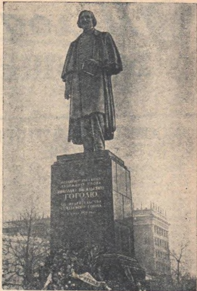
МОСКВА. 2 марта на Гоголевском бульваре состоялось торжественное открытие нового памятника великому русскому писателю Н. В. Гоголю.

Учащиеся Кузнецовской семилетней школы Черлакского района собрали для колхоза им. Хрущева свыше 50 центнеров местных удобрений и провели несколько воскресников по задержанию снега.