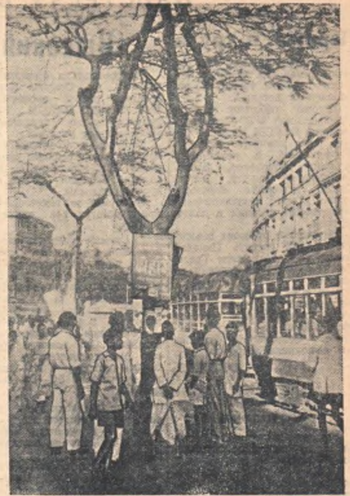
Недавно в Индии закончились выборы в центральный парламент и законодательные собрания штатов. НА СНИМКЕ: на улице Бомбея. У плаката, призывающего голосовать за одного из руководителей коммунистической партии Индии Данге.