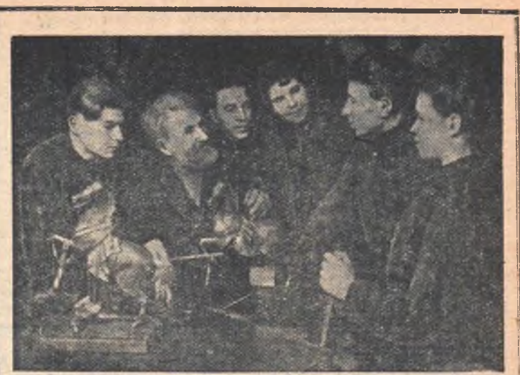
ЧЕЛЯБИНСКАЯ ОБЛАСТЬ. Каслинский чугунолитейный завод полтора века выпускает художественное литье — скульптуры, статуэтки, различные узорчатые изделия, резные решетки. Каслинские скульптуры из чугуна экспонировались на многих международных выставках.