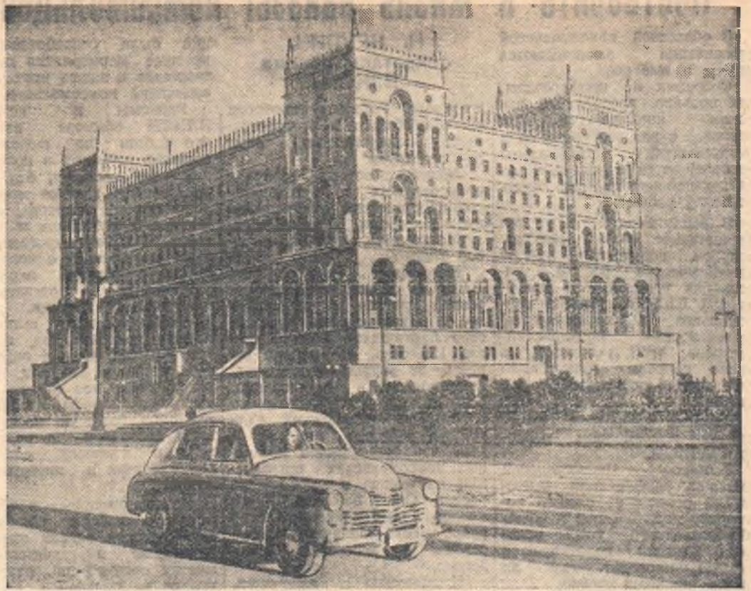
БАКУ. Дом Правительства Азербайджанской ССР.

Свой вклад во всенародную борьбу за повышение производительности труда, за лучшее использование техники, за снижение себестоимости продукции, за экономию и бережливость во всех отраслях хозяйства повседневно обязаны внести также комсомольцы, молодежь. Это будет лучшим их ответом на сталинскую заботу о процветании социалистической Отчизны.