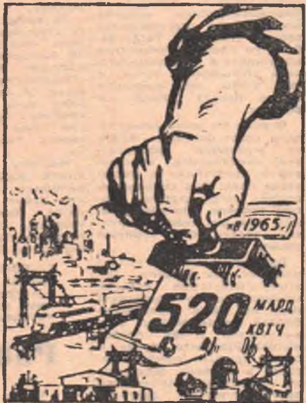
электроэнергии получит наша страна. Это в 2—2,2 раза больше, чем в 1958 году. Наряду с дальнейшей электрификацией промышленности в течение семилетия будут электрифицированы железные дороги протяженностью примерно в 20.000 километров, а также все совхозы, РТС, колхозы и рабочие поселки.

Дело в том, что в странах империализма господствует частная собственность на средства производства, т. е. такие экономические отношения, которые, давно уже вступив в противоречие с уровнем развития и характером современного производства, являются сильнейшим тормозом исторического прогресса. Мощные производительные силы заключены там в