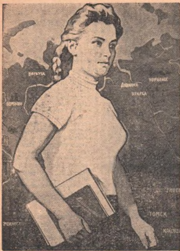
Плакат работы художника Б. Решетникова (Государственное издательство изобразительного искусства).