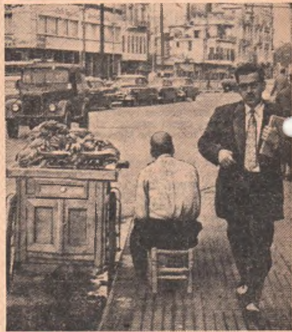
Объединенная Арабская Республика. Дамаск. В ожидании покупателя.