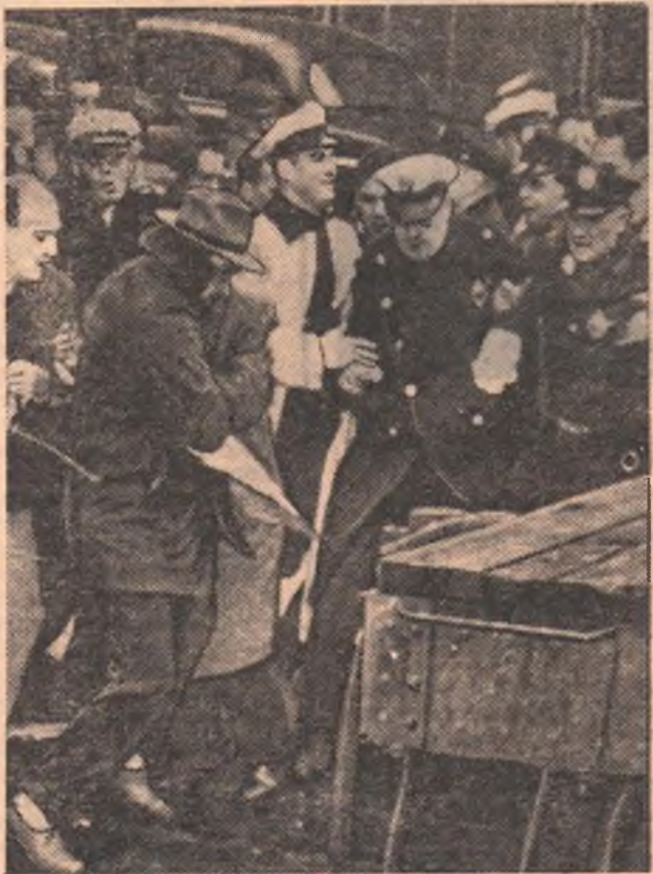
В Соединенных Штатах Америки бастует несколько тысяч рабочих восьми заводов сельскохозяйственного машиностроения компании «Эллис-Чалмерз мэнюфэчуринг компани». Недавно полиция разогнала пикет бастующих у завода компании в Питтсбурге. Полиция сбила рабочих с ног, применяла дубинки и муляжи.

Коммунистическая партия Китая призвала молодежь осваивать горные районы. Богатейшие края, нетронутые в течение веков земли хранили несметные сокровища. В высокогорных районах геологи открывают залежи железной руды, угля, руд ценнейших металлов. В долинах гор можно выращивать высокие урожаи зерна.