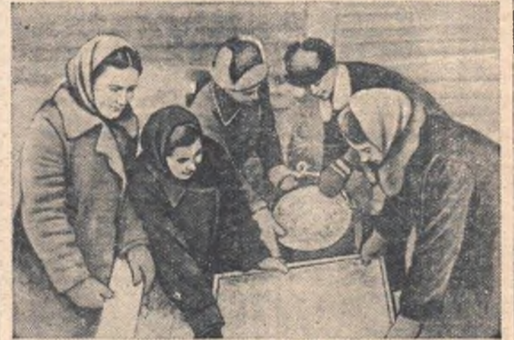
Пионеры Евгачинской средней школы Дзержинского района дали слово собрать для укрупненного колхоза им. Дзержинского 7,5 тонны местных удобрений. НА СНИМКЕ: пионеры отряда им. Олега Кошевого разгружают собранную золу.

Последние приготовления к выезду в поле ведут механизаторы Князевской МТС Называевского района. Здесь созданы две комсомольско-молодежные тракторные бригады. Их