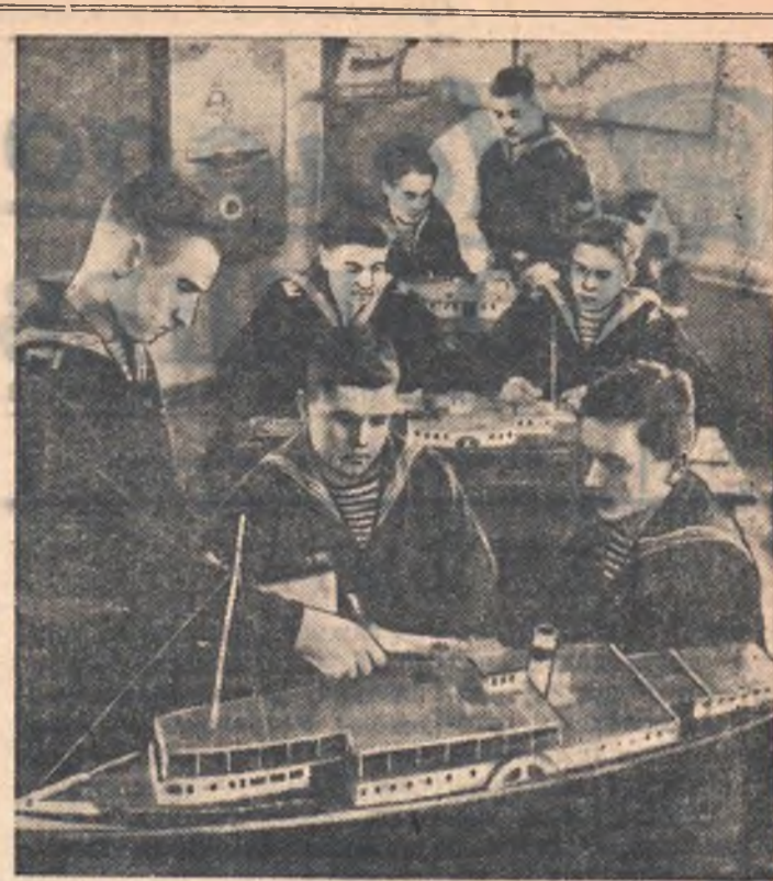
Молотовское речное училище готовит специалистов для речного транспорта. НА СНИМКЕ: слушатели штурманского отделения готовятся к экзаменам. Фото П. Лисенкина. (Фотохроника ТАСС).

обсуждалась на бюро райкома. Заявления учащихся Ребровской средней школы рассмотрены, всем принятым в ВЛКСМ вручены комсомольские билеты.