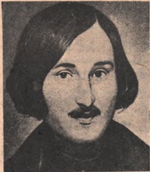
СЕГОДНЯ ИСПОЛНЯЕТСЯ 150-ЛЕТИЕ СО ДНЯ РОЖДЕНИЯ ВЕЛИКОГО РУССКОГО ПИСАТЕЛЯ НИКОЛАЯ ВАСИЛЬЕВИЧА ГОГОЛЯ (1809—1852).