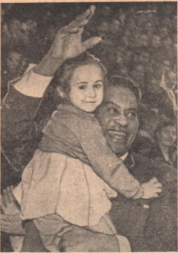
Москва. Гостящий в Советском Союзе известный негритянский певец Поль Робсон побывал на представлении «Една дружба» во Дворце спорта Центрального стадиона имени В. И. Ленина. На снимке: Поль Робсон приветствует детей, пришедших на елку.