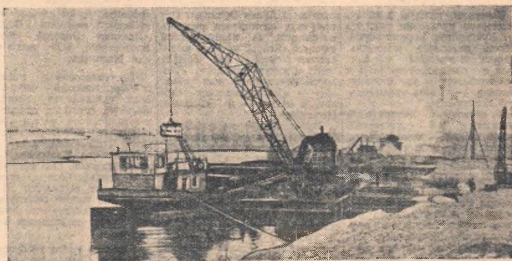
НОВАЯ КАХОВКА. В адрес строительства Каховского гидроузла со всех концов страны прибывают строительные материалы и механизмы. НА СНИМКЕ: разгрузка с барж прибывшего оборудования.