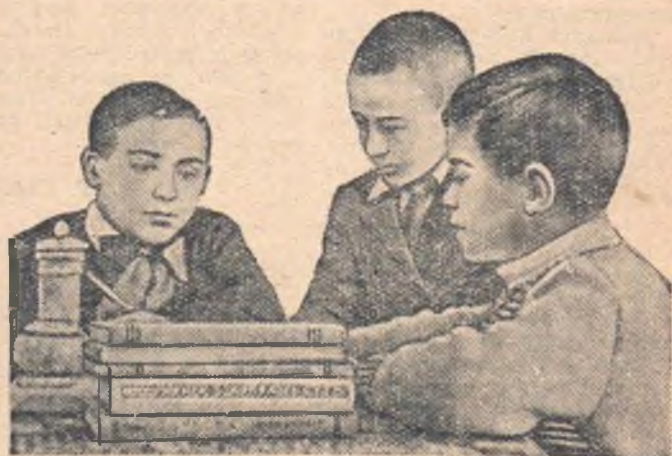
Ученики 4 «а» класса школы № 9 Сталинского района Омска начали подготовку к экзаменам. Они составили план повторения и занимаются группами, по 2—3 человека.