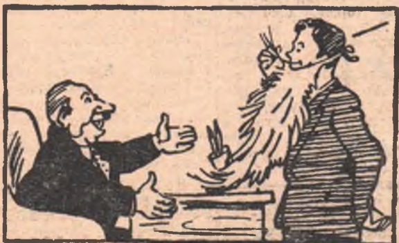
— На руководящую работу? Молоды еще...