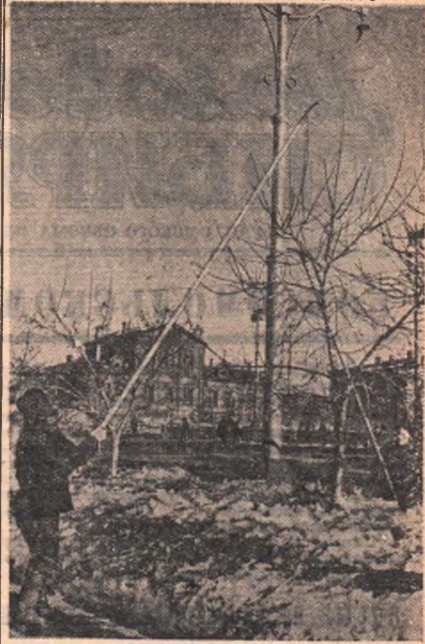
В город пришла весна.