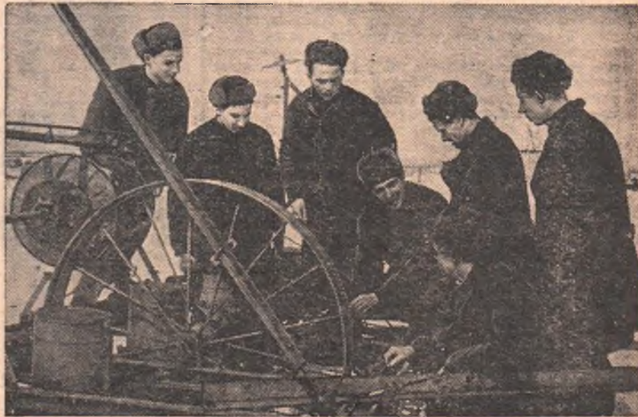
Этой весной выпускники Искля-Кульской школы механизации № 5 будут самостоятельно водить тракторы по колхозным полям. Сейчас они тщательно к этому готовятся.