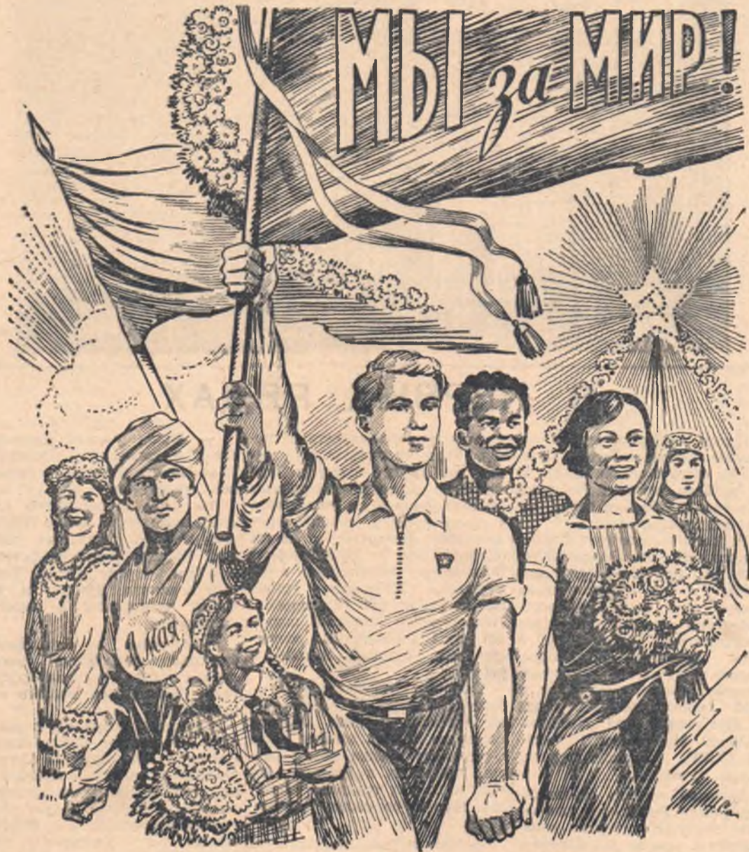
Рис. Н. САЗОНОВА.