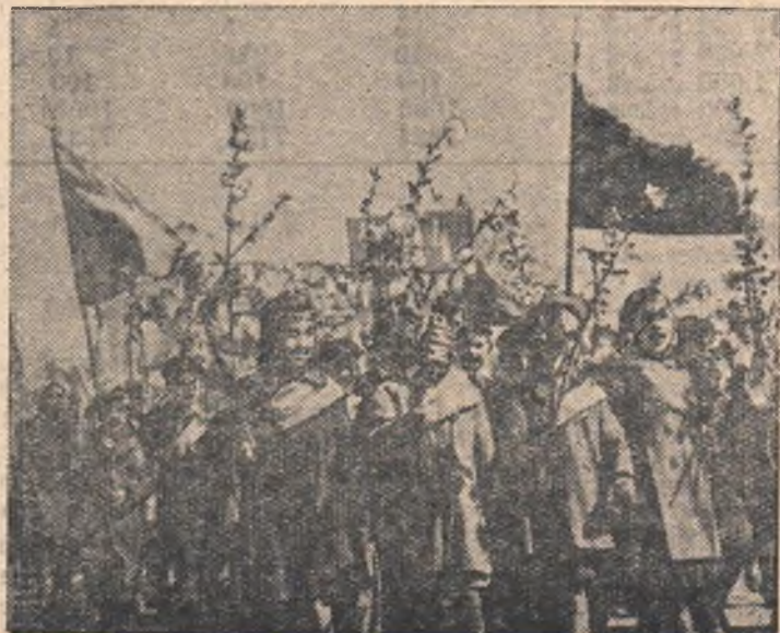
Праздничная демонстрация в Омске.

Многолюдной демонстрацией и праздничным митингом отметили Первомай горьковцы. В Доме культуры состоялся комсомольско-молодежный вечер. До поздней ночи веселилась молодежь села.