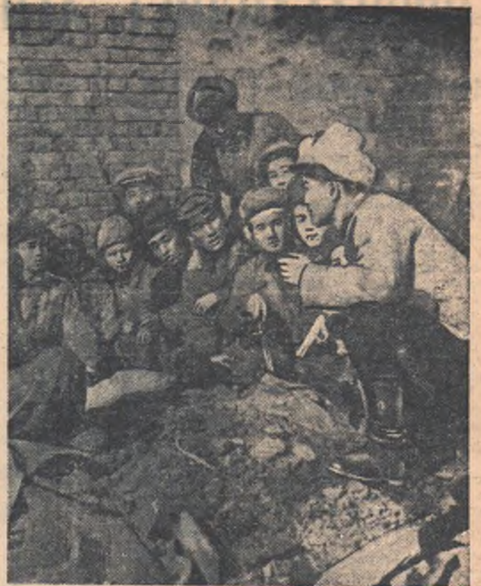
Корейская молодежь организует партизанскую борьбу в тылу врага. Юные мстители называют себя молодоговардейцами в честь советских краснодонцев. НА СНИМКЕ: группа молодоговардейцев Кореи.