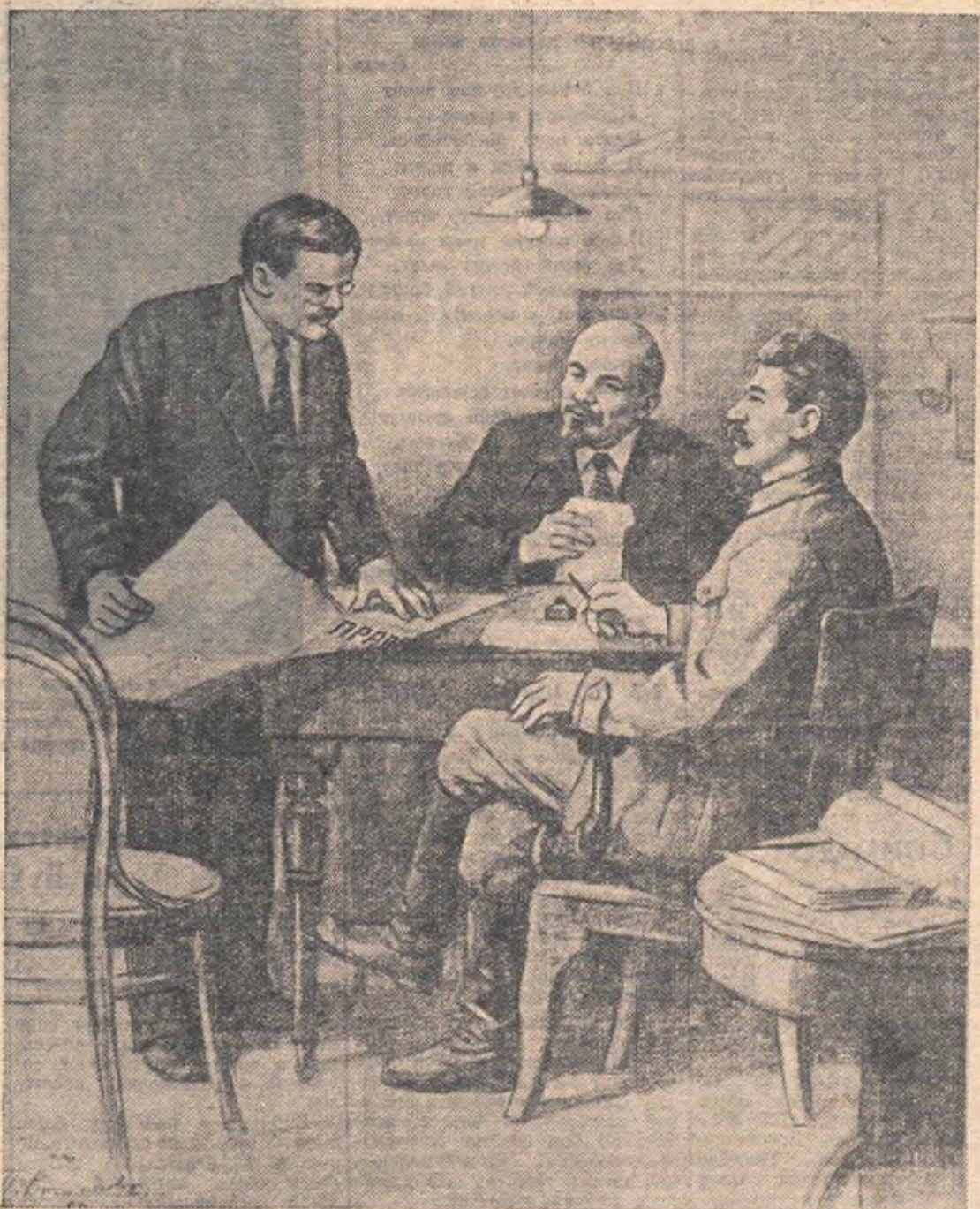
В. И. Ленин, И. В. Сталин и В. М. Молотов в редакции газеты «Правда» 1917 г. С рисунка художника П. Васильева.

6 мая в Омске будут проведены велогонки, посвященные Дню большевистской печати.