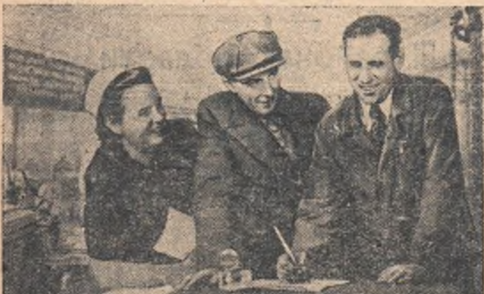
ВСЕ КАК ОДИН ПОДПИСЕМСЯ НА НОВЫЙ ЗАЕМ!

Плакат работы художников Б. Березовского и Б. Мухина, выпускаемый Госфиниздатом.