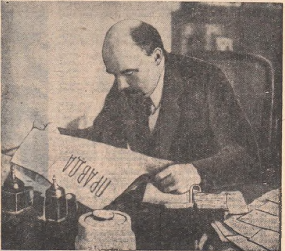
В. И. Ленин в рабочем кабинете.