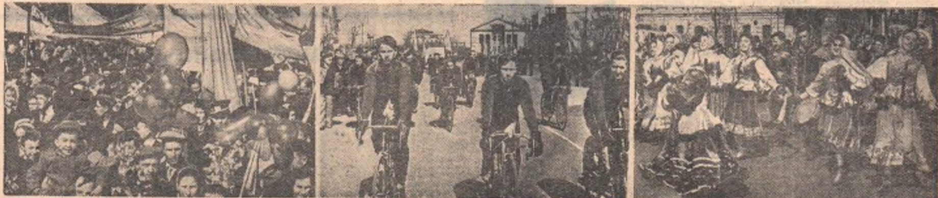
Праздничная демонстрация трудящихся города Омска.

Ликующий май льется широкой рекой. И дома словно раздвинулись, улицы стали шире. Дорогу! Молодость идет!