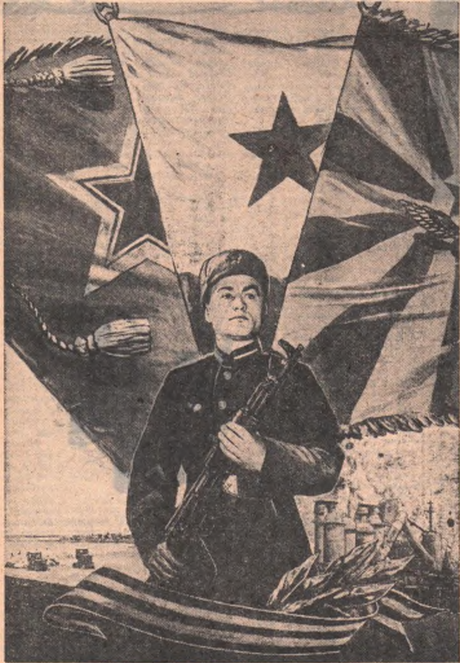
Фотомонтаж Б. Антонова.