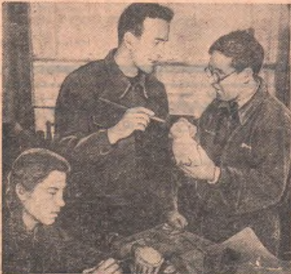
Нарисовать или вылепить из глины, из пластилина самостоятельно какое-либо школьное наглядное пособие, описывается, не так просто. А для учителя уметь это делать просто необходимо. Вот почему в Омском педагогическом училище занятиям по труду придается большое значение.