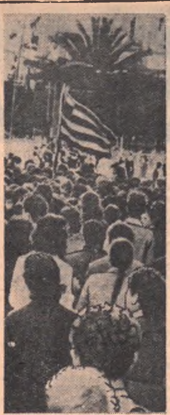
Кипр. Усилившиеся за последнее время репрессии английских колонизаторов не могут сломить воли киприотов и борьба за самоопределение их родины. Во многих городах острова проходят демонстрации протеста.