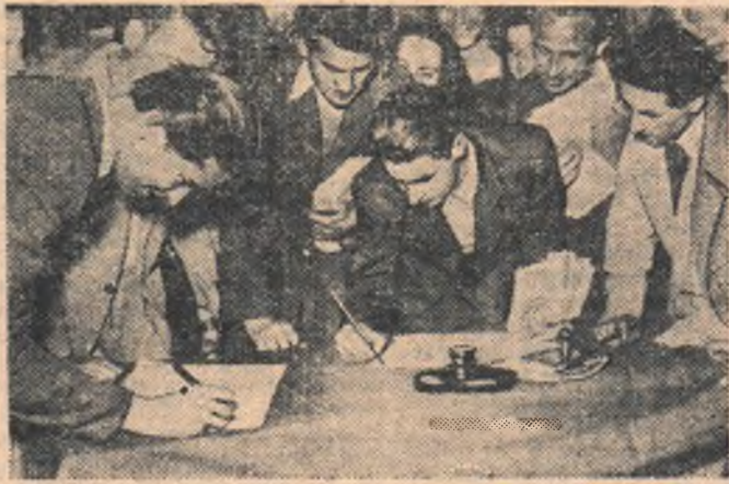
Рабочие, крестьяне, интеллигенция Румынской народной республики единодушно присоединяются к Обращению Всемирного Совета Мира о заключении Пакта Мира между пятью великими державами. НА СНИМКЕ: студенты университета в г. Клуж подписываются под Обращением.