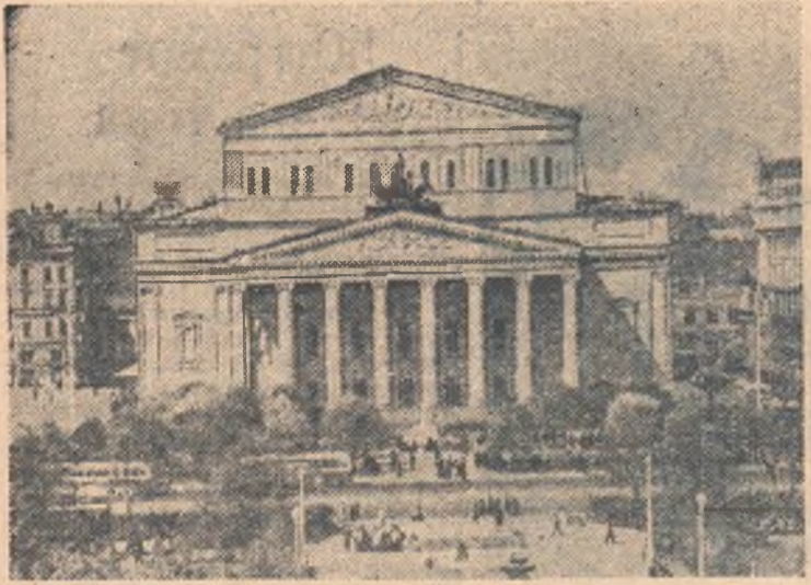
МОСКВА. Государственный ордена Ленина Академический Большой театр Союза ССР. Фото А. Батанова (Фотохроника ТАСС).