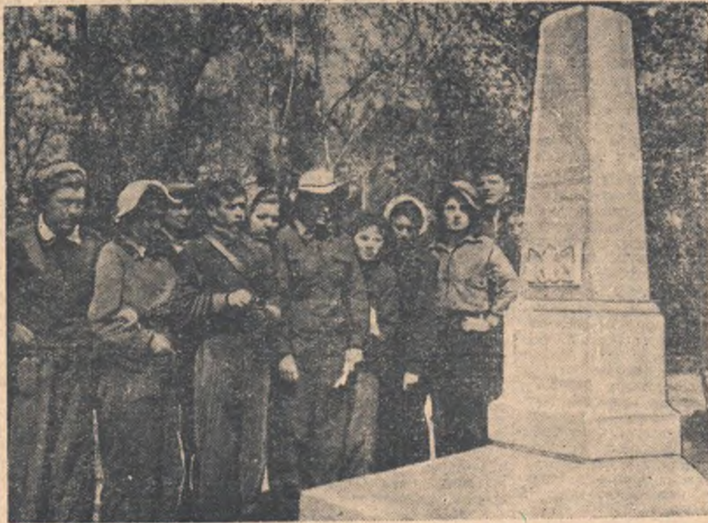
Пионервожатые школ города совершили туристский трехдневный поход по маршруту Омск — сад Комиссарова. НА СНИМКЕ: участники похода у памятника на могиле Комиссарова.