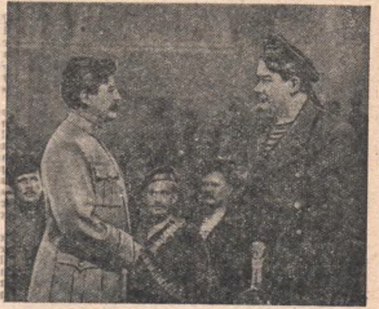
Кадр из фильма «Незабываемый 1919 год».

Более трех десятилетий отделяют нас от событий, показанных в этом кинофильме. Но зритель воспринимает кино-