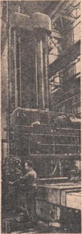
Среди машиностроитель- ных предприятий Чехосло- вацкой Республики одним из крупнейших является завод имени В. И. Ленина в Пльзене. В этом году заводу исполняется 100 лет.

Машины с маркой этого предприятия — станки, локомотивы, детали к тур- бинам — пользуются все- мирной известностью.