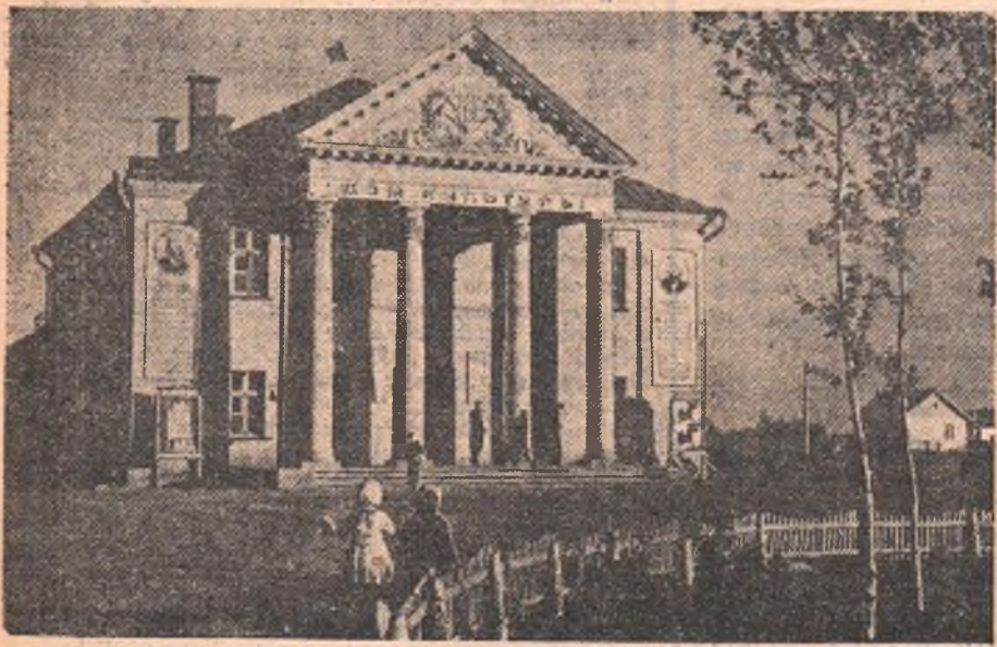
Это красивое здание — Дом культуры Русско-Полянского района. Весело и интересно бывает здесь по вечерам. Целинники приходят сюда послушать лекцию, посмотреть новый кинофильм, потанцевать. Очень довольна молодежь своим Домом культуры!

Н. ФРОЛОВ, резиносмесильщик подготовительного цеха шинного завода.