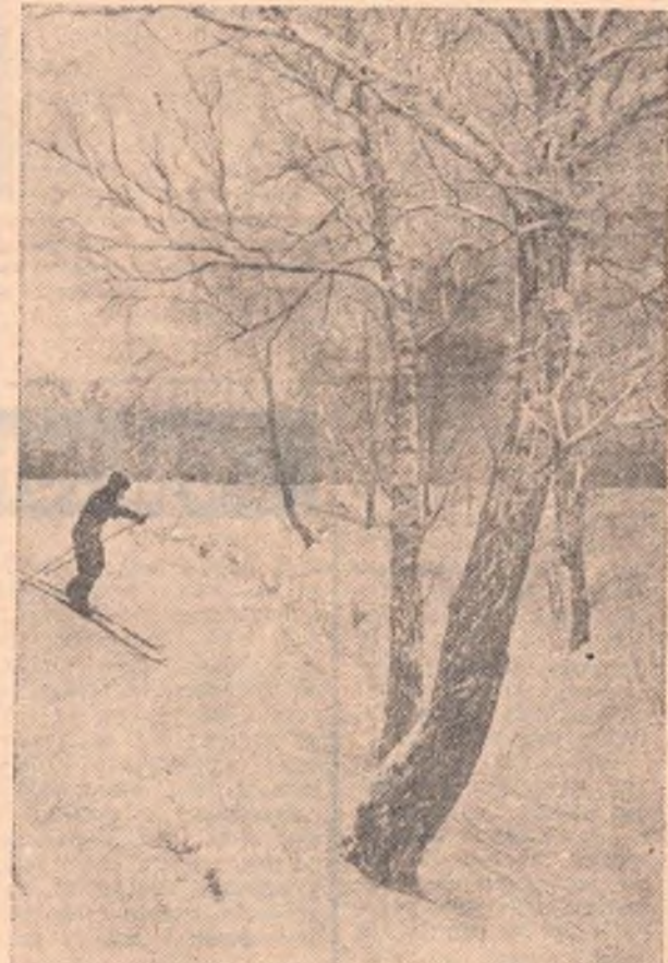
В зимний день.

В Красноярске проходили зональные соревнования среди школьников по лыжному спорту. Сборная команда школьников нашей области заняла общее четвертое место.