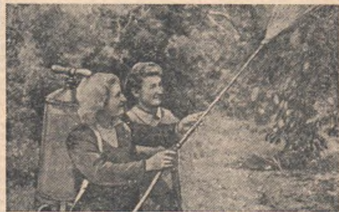
Студенты 3-го курса естественно-географического факультета педагогического института проходят практику на областной станции юннатов.

Молодые хвойные деревья будут рассажены у колхозных водоемов, высажены в защитных полосах, украсят сельские парки и стадионы.