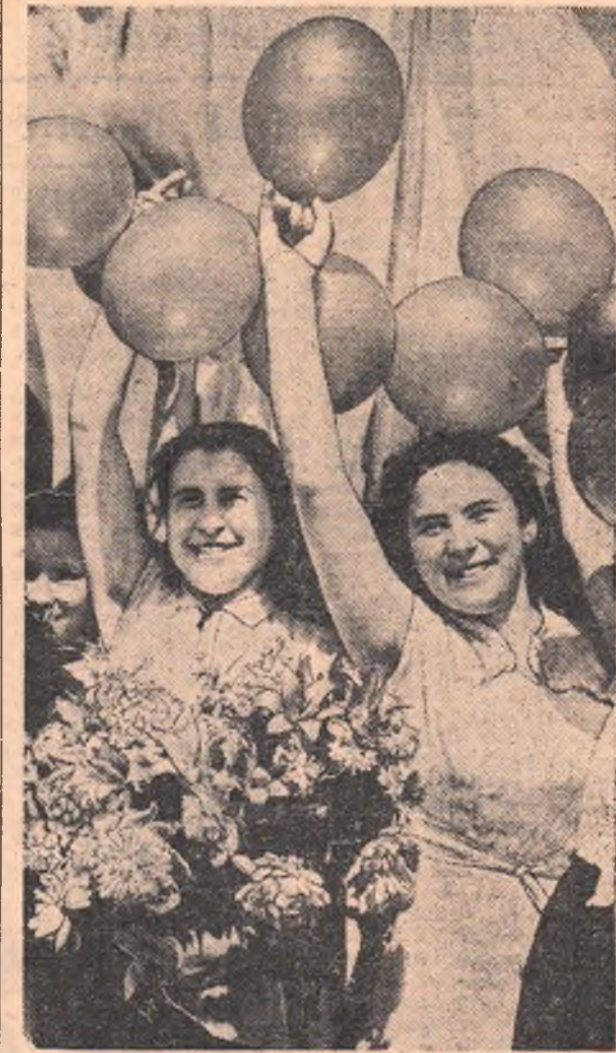
Как радостно улыбаются эти девушки! Навсегда запомнят они веселый и торжественный праздник — День советской молодежи. О том, как отметили юные омичи это большое событие в жизни молодежи страны, читайте на второй странице.