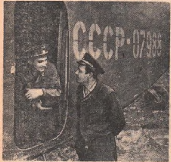
Прополка с воздуха — такова работа, которую проводят на полях области пилоты. Обрабатывая химикатами посевы, летчики уничтожают сорняки и одновременно вносят в почву подкормку для культурных растений.

секретарь комитета ВЛКСМ завода «Омсельмаш».