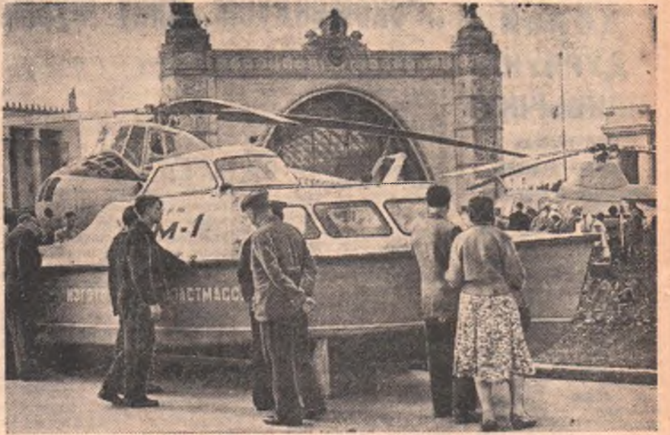
Выставка достижений народного хозяйства СССР. На открытой площадке у павильона «Химическая промышленность». Речной катер, изготовленный из пластмассы.