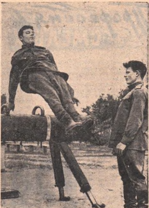
Много сил и времени отдают курсанты Омского высшего военного училища имени Фрунзе физической подготовке.

Еще через двое суток пути ученый остановился в Омске.