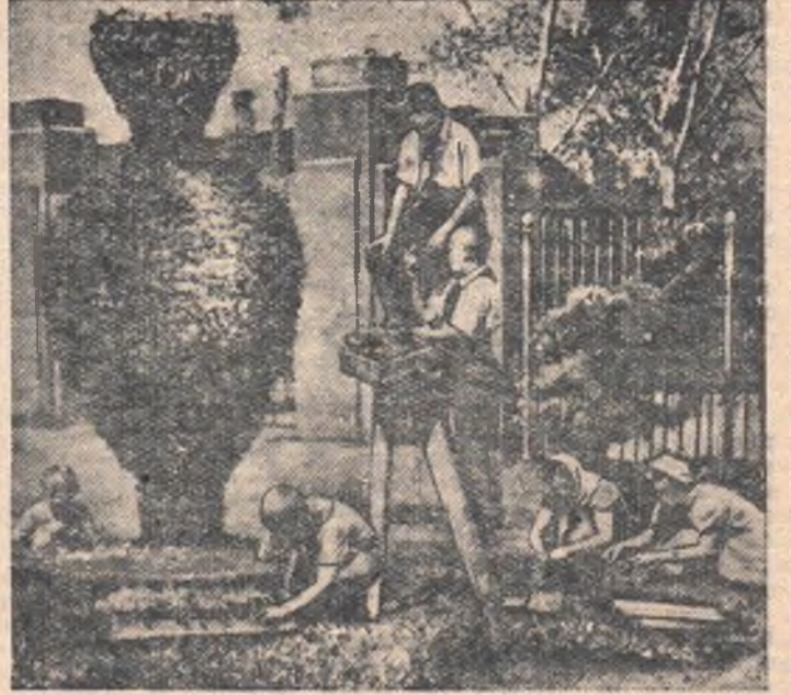
НА СНИМКЕ: юные цветоводы Омской областной станции юннатов высаживают рассаду у входа на территорию станции.