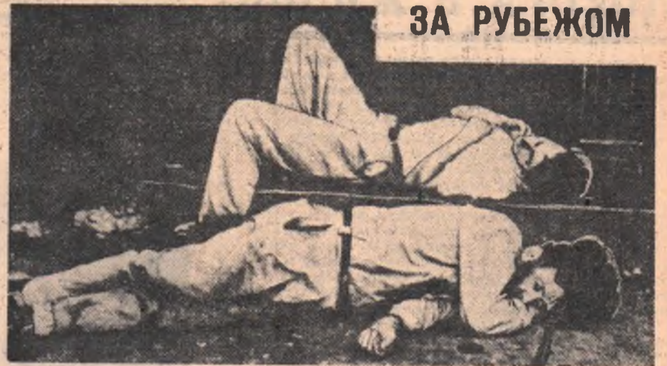
Соединенные Штаты Америки. Безработица — постоянный бич американских рабочих. На улицах больших городов часто можно увидеть людей, которые давно потеряли работу, а с ними и кров и хлеб. НА СНИМКЕ: вечером на одной из улиц Чикаго.