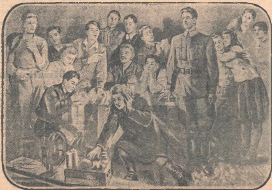
П. П. Соколов-Скаля. «Краснодонцы» (молодогвардейцы слушают по радио выступление товарища Сталина).