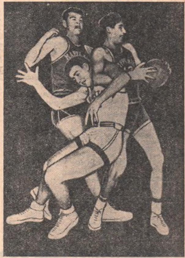
Вот он, американский баскетбол...

Курс «физического образования» в высших учебных заведениях США подчинен целям внешней милитаристической политики Соединенных Штатов Америки. Как заявил на собрании «Христианского объединения молодых людей» Эйзенхауэр: «Истинное назначение американского спорта — в подготовке молодежи к войне...».