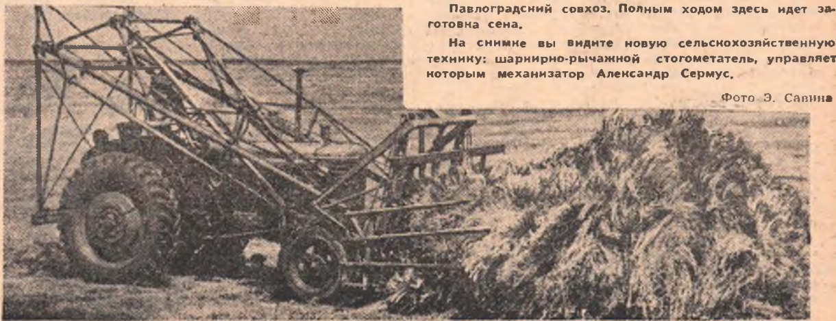
Павлоградский совхоз. Полным ходом здесь идет заготовка сена.